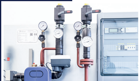
Für den Anschluss an das Fernwärmenetz entwickelt